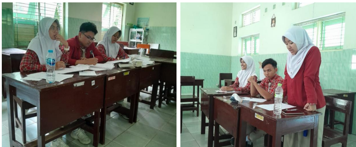
Gambar 2. Simulasi debat.

Selanjutnya, dalam panggung Simulasi Debat dan Praktik, peserta akan dikelompokkan dalam beberapa kluster sesuai dengan topik yang disediakan dan diberikan debat yang harus mereka siapkan. Setiap kluster diberikan peran sebagai afirmasi atau oposisi. Pada sesi ketiga ini, peserta dapat membahas dan bersiap untuk penugasan tersebut yang dibentuk pada teknik pembentukan argumen sebelumnya. Simulasi seperti digambar 2, bagian ini tidak hanya mendidik peserta untuk membentuk argumen yang logis dan faktual tetapi juga bagaimana berpikir dengan kritis dan melakukannya dengan cara yang tepat dan jelas. Tujuan dari simulasi ini adalah untuk mengajarkan peserta agar dapat menggunakan pengetahuan mereka dalam membentuk kebenaran yang kompleks ke dalam kekacauan yang siap dimanipulasi dalam konteks sebenarnya, termasuk bagaimana memberi tahu audiens sementara merespons argumen balasan.