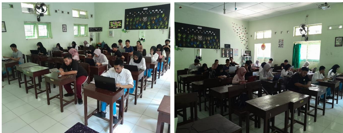
Gambar 1. Penyampaian materi pelatihan kepada peserta.

Penyelenggaraan program kegiatan layanan masyarakat menggunakan pendekatan partisipatif yang dilakukan oleh peserta dalam artian peserta tidak hanya mendengarkan serta belajar secara aktif namun juga mengikuti langkah demi langkah setiap pelatihan. Metode penyelenggaraan kegiatan meliputi aktivitas utama sebagai berikut; perencanaan, pelaksanaan seperti di gambar 1 dan evaluasi.