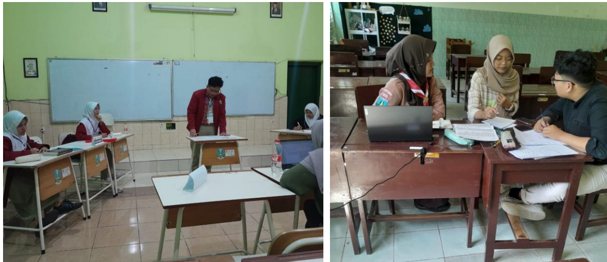
Gambar 3. Evaluasi program kegiatan.

Evaluasi program dilakukan untuk mengukur efektivitas pelatihan serta dampaknya terhadap peserta dalam mengembangkan keterampilan berpikir kritis dan berbicara. Proses penilaian seperti Digambar 3, dilakukan secara sistematis dengan melibatkan observasi langsung, wawancara, dan umpan balik dari peserta.